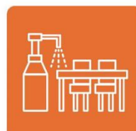
消毒・洗浄します