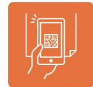
北海道コロナ通知システムと 接触確認アプリ(COCOA)を お客様にお知らせします