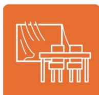
こまめに換気します