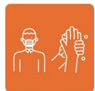
お客さまへ咳エチケット・ 手洗いをお願いします