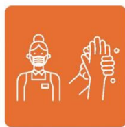
マスク着用・ 手洗いを徹底します