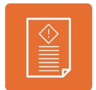
取組を お知らせします