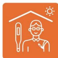
健康管理を 徹底します